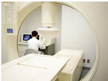
サーモترون-RF8 GR edition

治療台に寝ていただき、上下の電極で患部をはさみます。 体型やその日の体調に応じて出力を調整し、約 40 分間加温します。