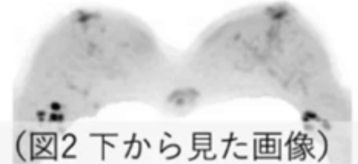
(図2 下から見た画像)