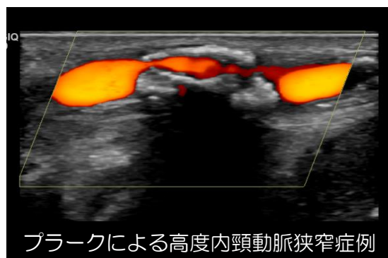
プラークによる高度内頸動脈狭窄症例